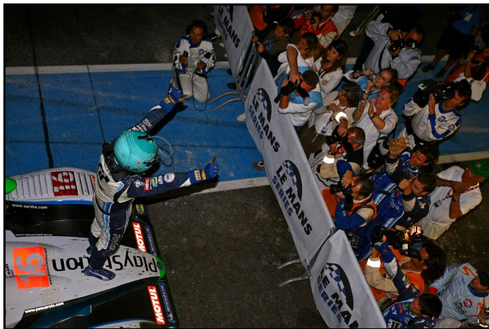
Luc Alphand Aventures empile les victoires tandis que JMW Motorsport domine la catégorie GT2.

Les caractéristiques du circuit de l'Algarve font penser aux anciens circuits britanniques ou américains. Tours, détours et dénivelés sur la totalité du tracé le font ressembler à des montagnes russes recouvertes d'asphalte. Tous les pilotes couvrent d'éloges le nouveau circuit, qui nous a proposé un spectacle intense.